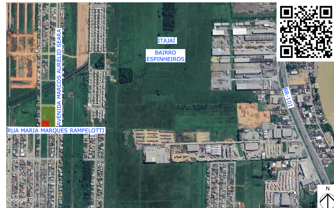
Localização Sem Escala